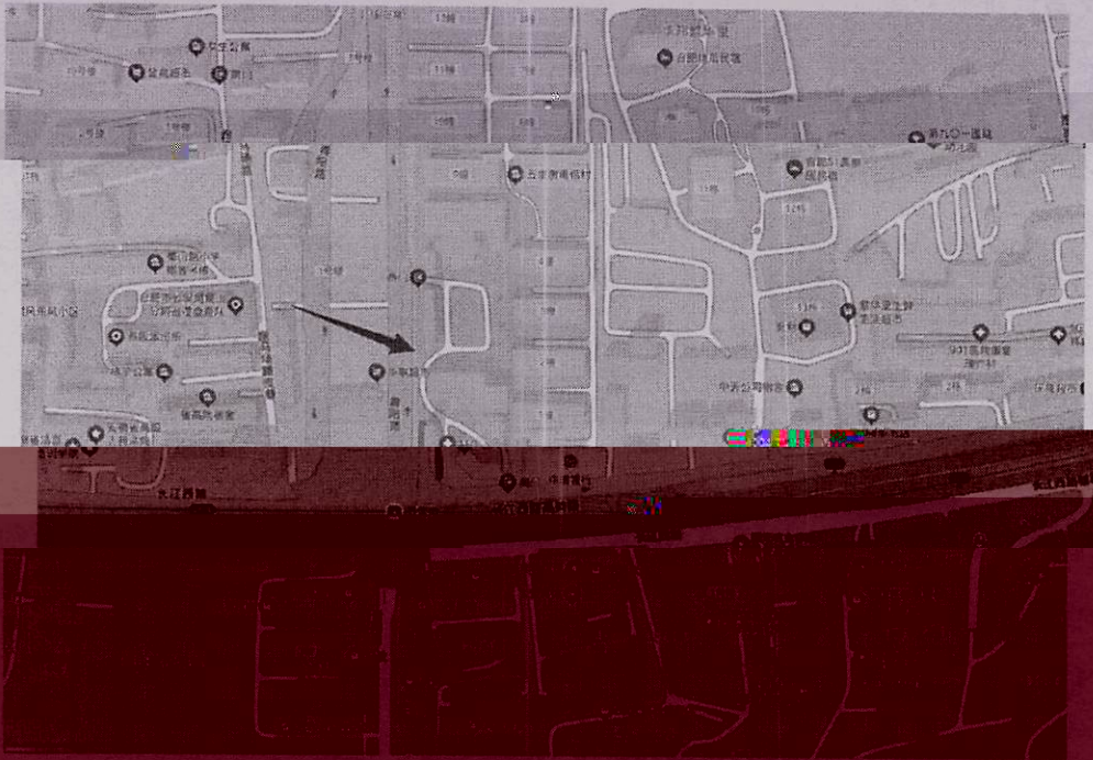
图一：标的所在位置（仅供参考，以实地踏勘为准）