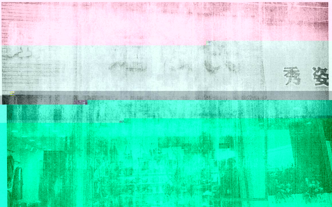
图二：标的外观（红框内仅供参考，以实地勘察为准）